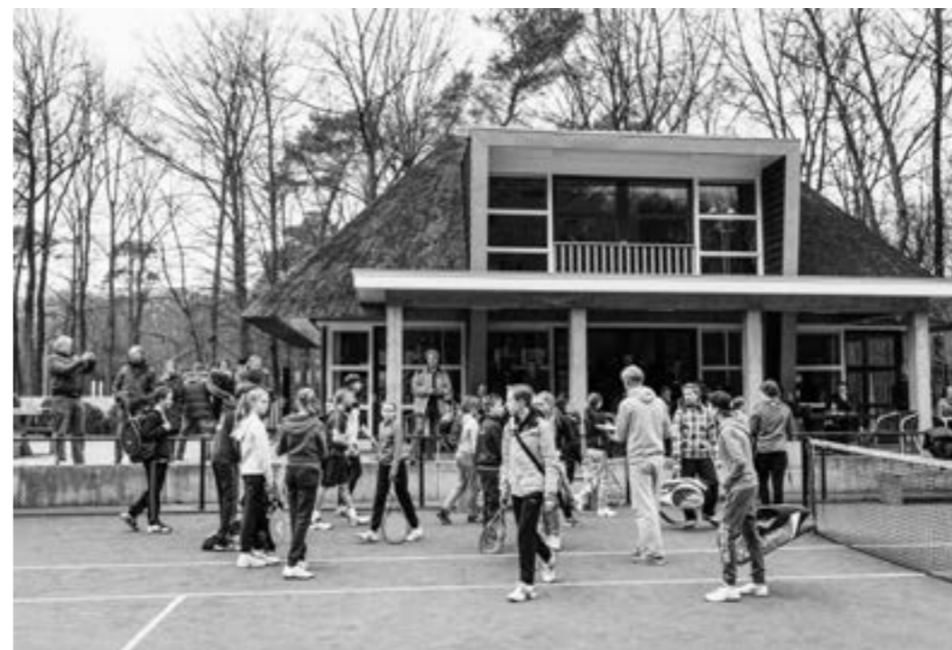
Veel enthousiasme bij deelnemers en publiek